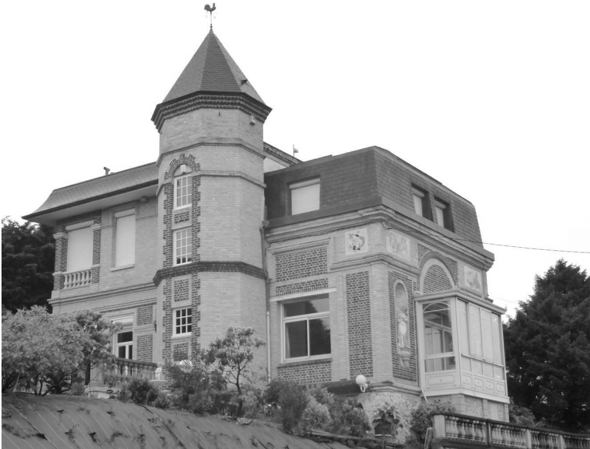
État actuel de la villa de Sarah à Sainte-Adresse.

Est-elle allée se recueillir sur la tombe de son père ?