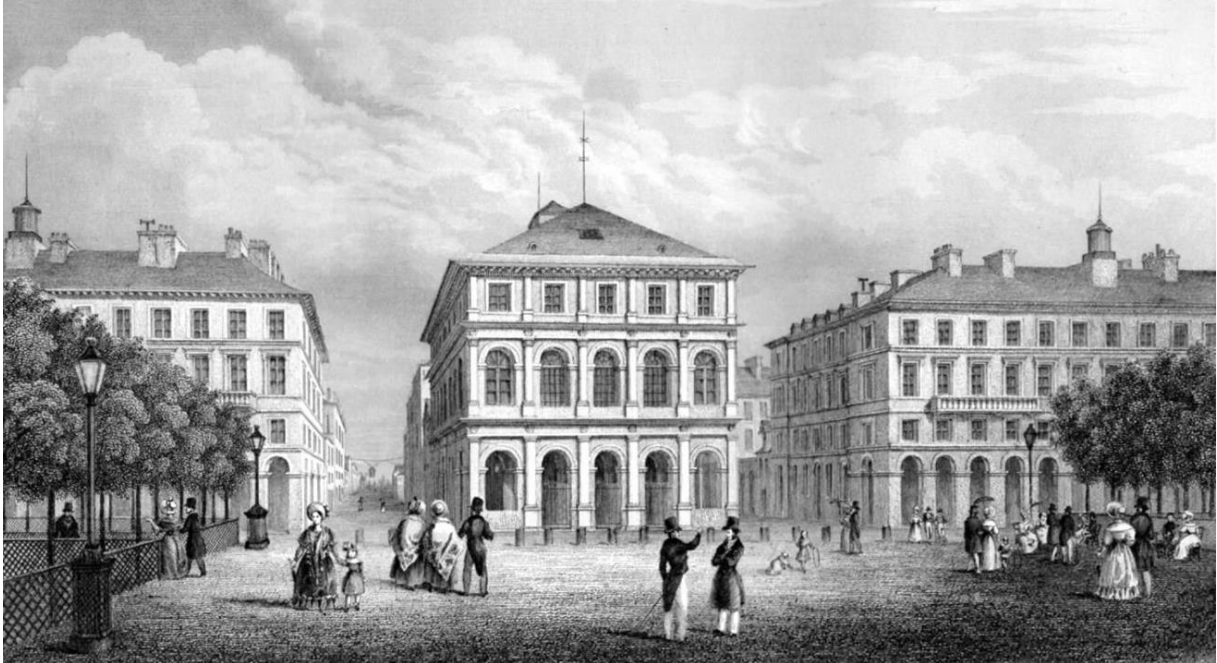
Le Havre, place Louis XVI. Les arcades sud sont à gauche du théâtre.

Édouard habite Ingouville sur le Perrey à cette époque 4 . L'étude installée au Havre, place Louis XVI, arcades sud n° 1 prospère, malgré la vie sentimentale agitée du jeune avoué.