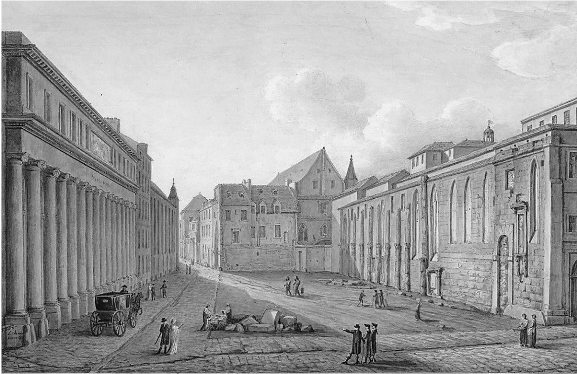
La place de l'École-de-Médecine en 1803, par Chancourtois